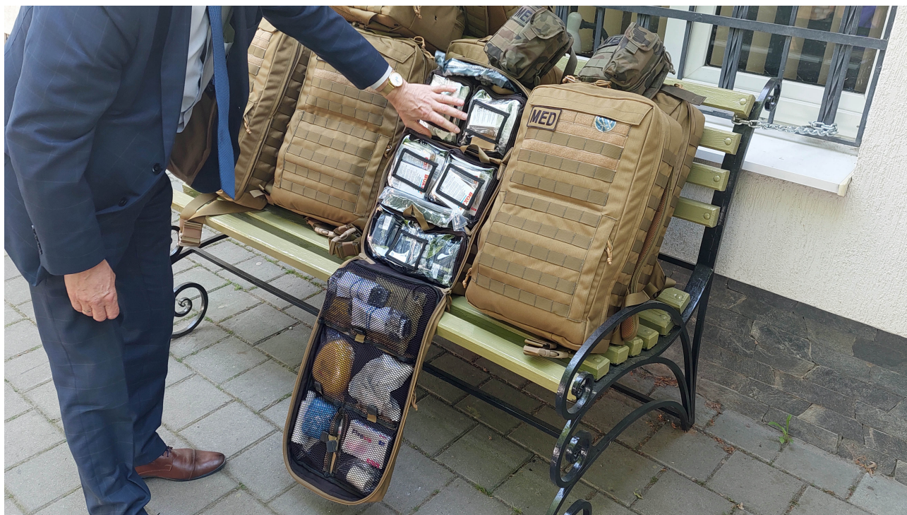
Wnętrze jednego z plecaków ratunkowych. Wyposażenie tej "superapteczki" zgodne jest ze standardami wojsk NATO