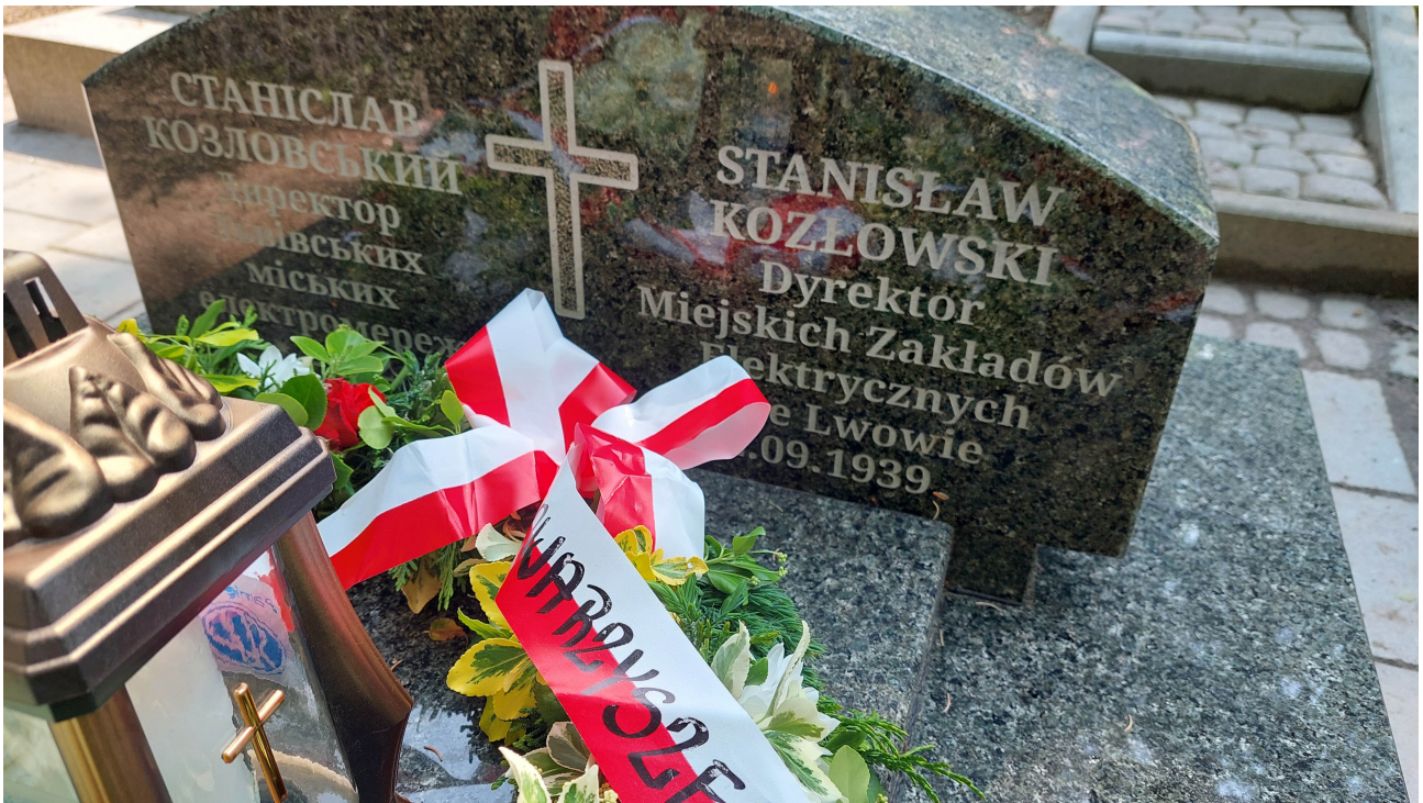
Pomnik nagrobny Stanisława Kozłowskiego ufundowało Przedsiębiorstwo PSA "Lwiobłenergo"