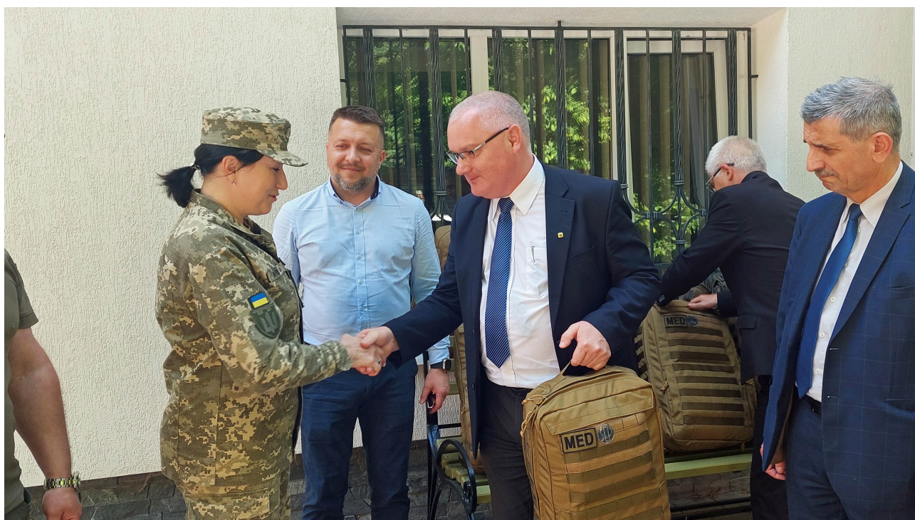
Plecaki z rąk Prezesa SEP odbierają przedstawiciele Sił Zbrojnych Ukrainy