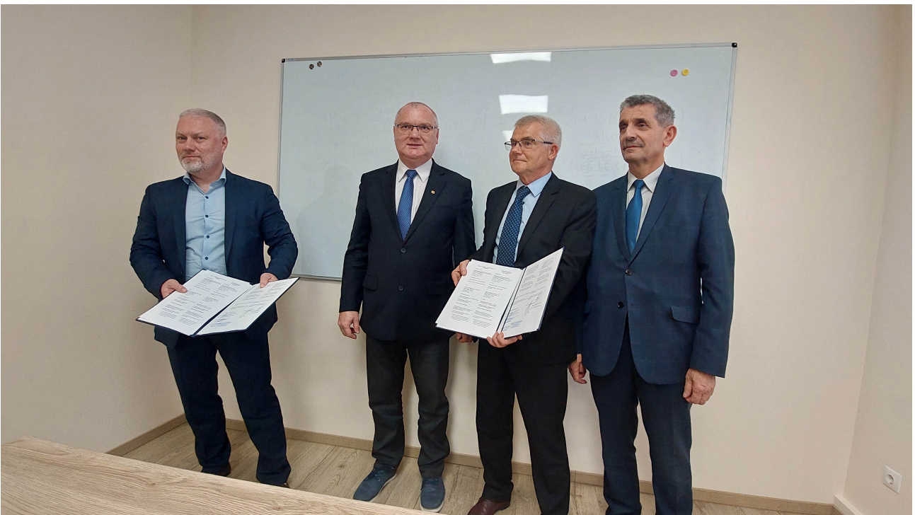
Sygnatariusze prezentuj podpisane porozumienie...