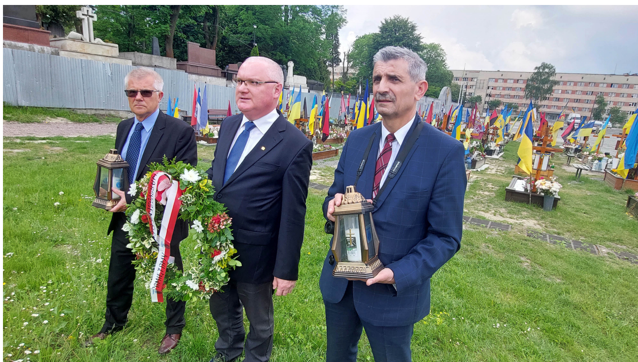
Delegacja SEP podczas składania kwiatów i zniczy na cmentarzu żołnierzy poległych w latach 2022-2023