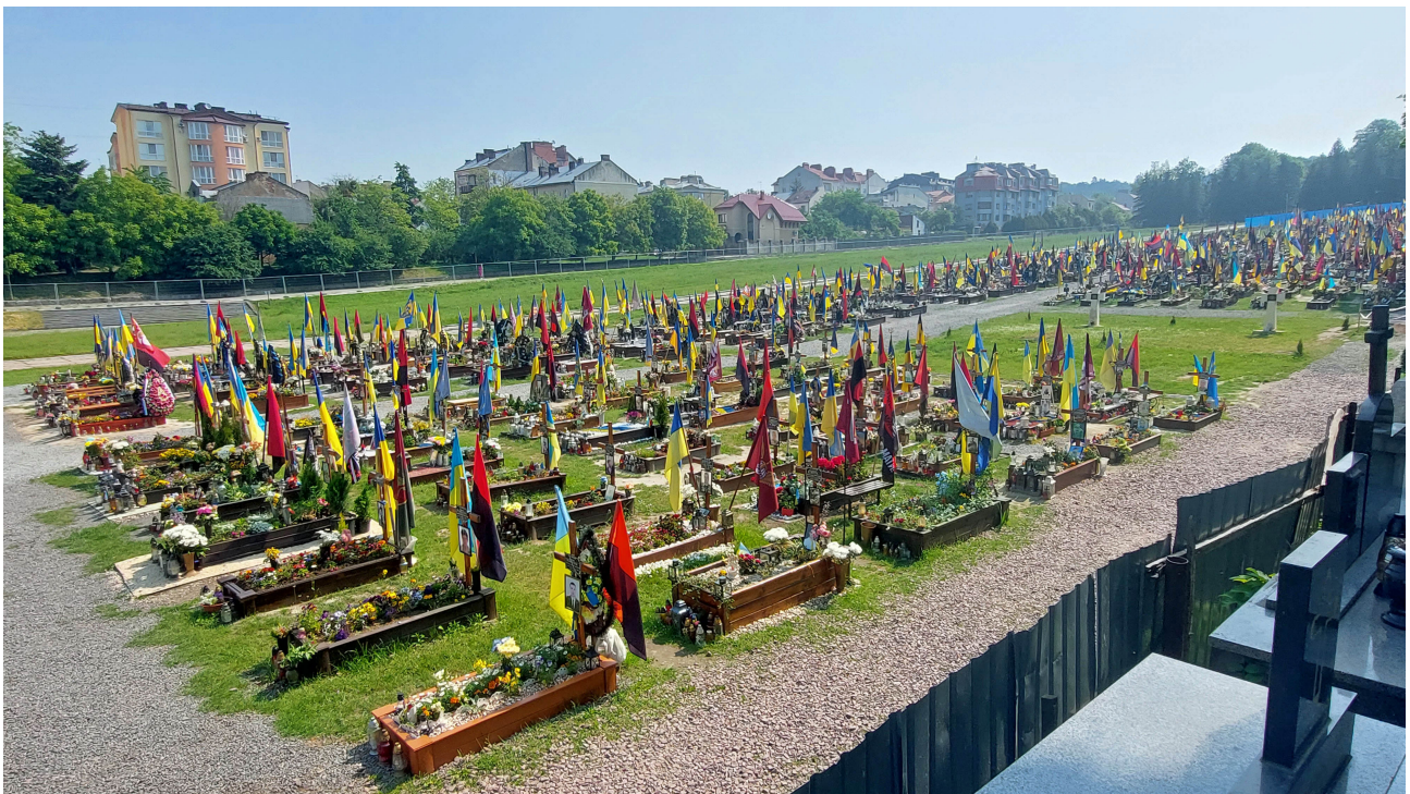
Cmentarz żołnierzy poległych w walce z rosyjską agresją na Ukrainę w latach 2022-2023