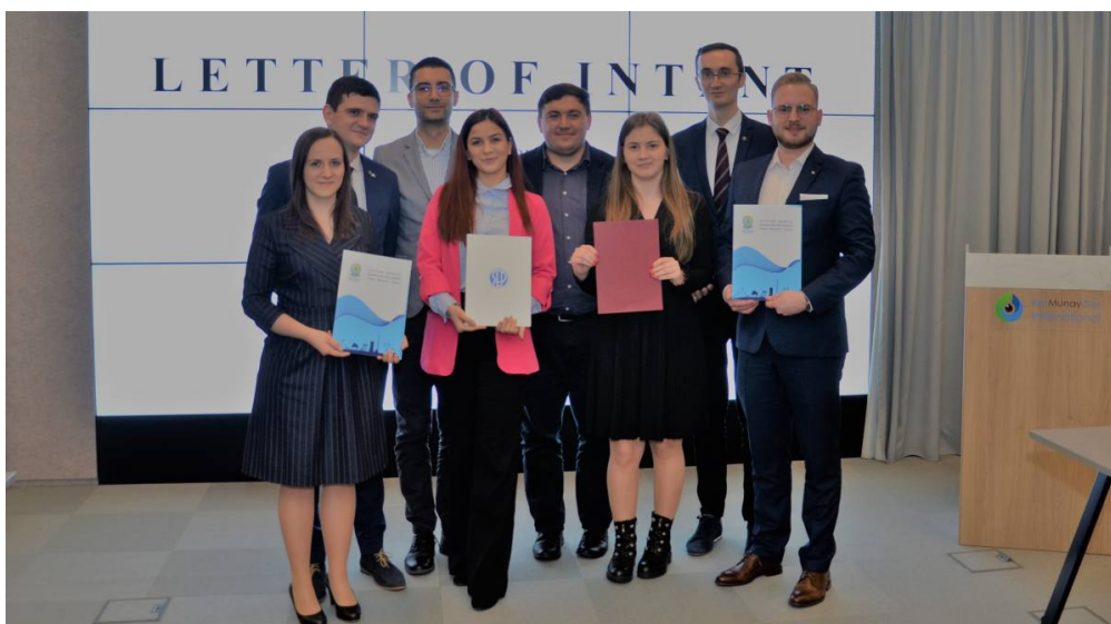
Po podpisaniu listu intencyjnego.