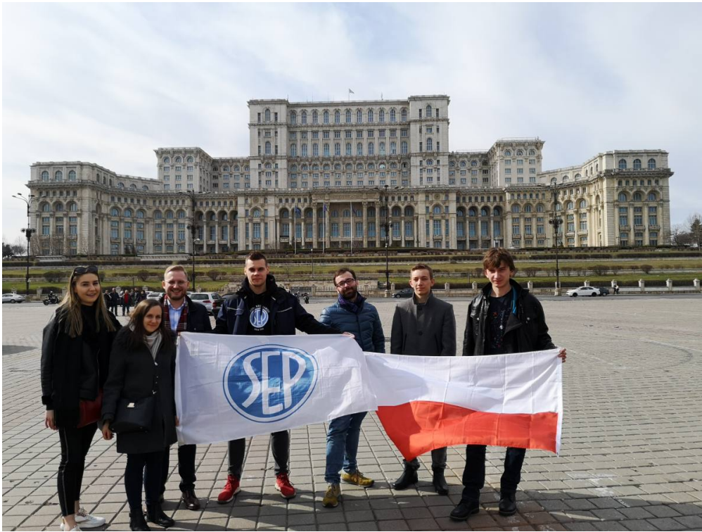
Przed budynkiem Parlamentu.