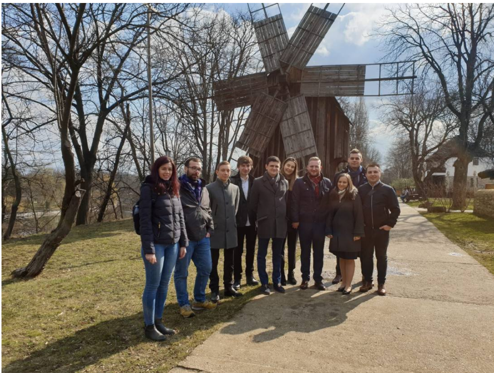
Przed Muzeum Wsi.

Przygotowała: Anna Dzięcioł – Główny Specjalista Działu Rozwoju Naukowo-Technicznego Biura SEP, na podstawie opracowania: Michała Wesółskiego, Julii Soleckiej i Wojciecha Gawła