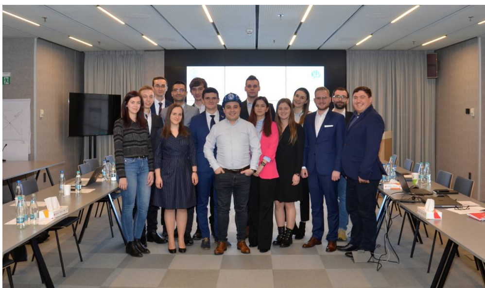
Wszyscy uczestnicy spotkania - młodzież rumuńska otrzymała od nas symboliczny kask SEP.

W ramach części turystycznej wyjazdu, w sobotę przed rozpoczęciem seminarium, uczestnicy zwiedzili Muzeum Wsi oraz Pałac Parlamentu. Pałac Parlamentu w Bukareszcie jest jedną z głównych atrakcji Rumunii i drugim największym budynkiem na świecie.